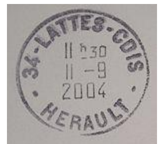
Cachet à date français, année 2004

L'oblitération Premier jour est un cachet à date.