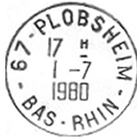
Timbre plastique de 1965 (utilisé à l'heure actuelle)