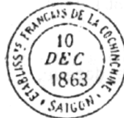
Occupation de Cochinchine (1863)

L'oblitération doit rendre le timbre poste inutilisable. Pour remplir cette fonction, elle doit être visible et impossible à effacer. L'encre doit résister à l'eau et à tout traitement chimique. Le but est atteint lorsque l'effacement de l'oblitération conduit à la destruction du timbre. Au début du timbre poste, diverses encres sont utilisées et testées. L'oblitération devient de plus en plus lourde jusqu'à masquer la presque totalité du timbre. Mais certains proposent une façon encore plus radicale d'annuler le timbre, en le détruisant.