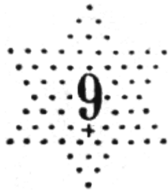
Variété d'étoile chiffree