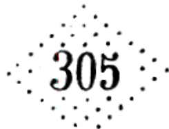
Losange gros chiffres