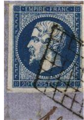
Voir aussi les marques postales.